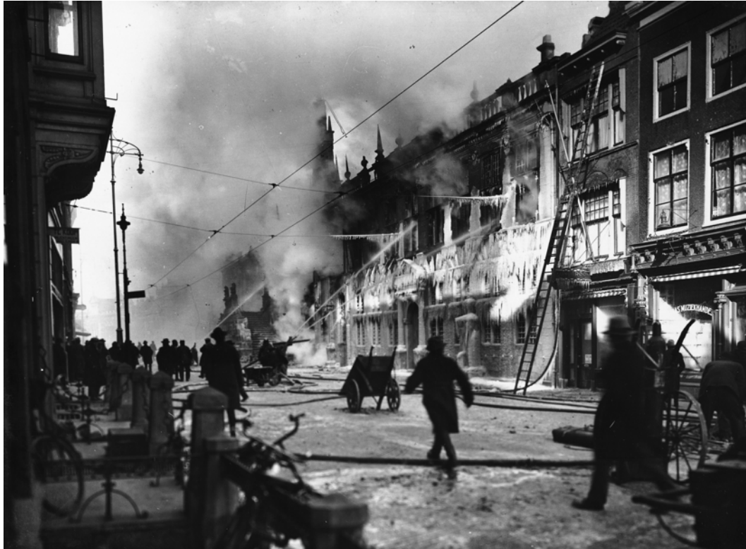
Stadhuisbrand 1929, PV16950.5.