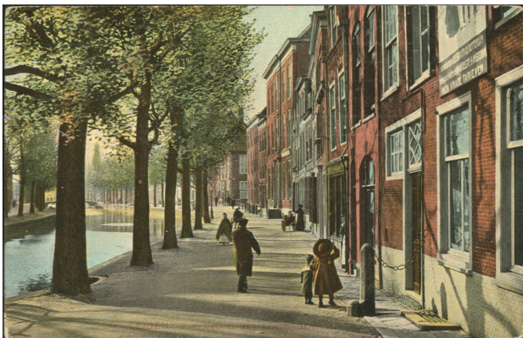
Wonen op het Rapenburg, PBK0850.

Bedenk wel, dat het om goed huizenonderzoek te kunnen doen van belang is ook de buurhuizen in het onderzoek te betrekken. Huizen kunnen in het verleden wel eens deel hebben uitgemaakt van een groter complex of twee kleinere huizen kunnen op een gegeven moment tot het huidige huis zijn samengevoegd. Daarnaast geven buurhuizen ook houvast bij het onderzoek omdat in veel bronnen buurhuizen specifiek als belending worden genoemd.