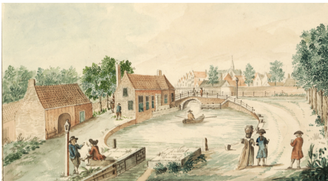
De Naakte Sluis, 1788, PV4877.2 (detail).

De derde kolom tenslotte vermeldt soms een code, bijvoorbeeld ‘4Z15’. Zo’n code verwijst naar het Waarboek , waar de eigenlijke verkoop staat beschreven (4Z15= Rechterlijk Archief, inv.nr. 67, deel ZZZZ, fol. 15) De verervingen werden niet altijd in het bonboek bijgeschreven, vooral indien de boedel onverdeeld bleef. Het komt voor, dat een huis een eeuw lang in de familie is gebleven, waarbij het eigendom in het bonboek niet werd gewijzigd.