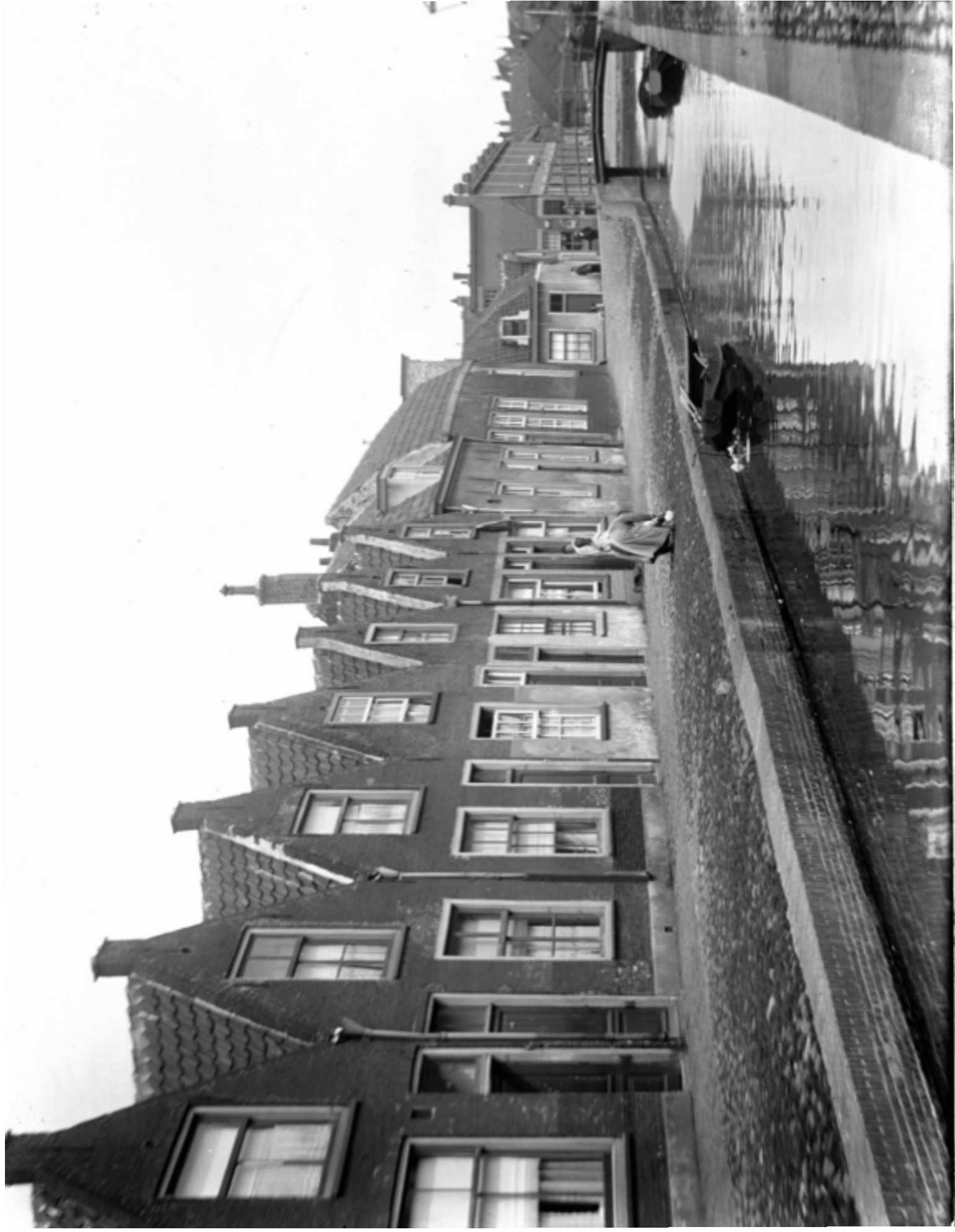
Waardgracht, ca. 1900