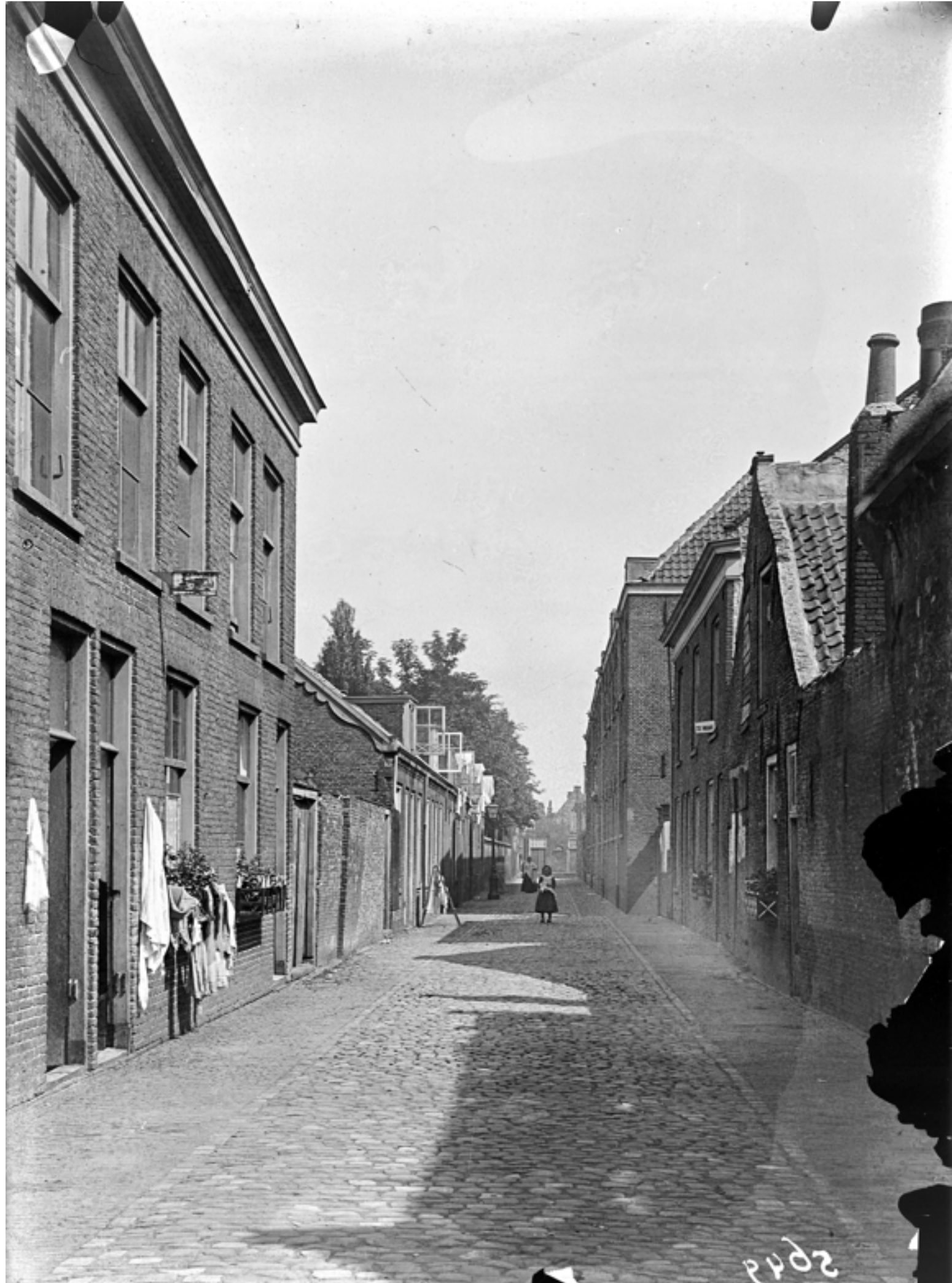
Kaarsenmakersstraat, ca. 1900