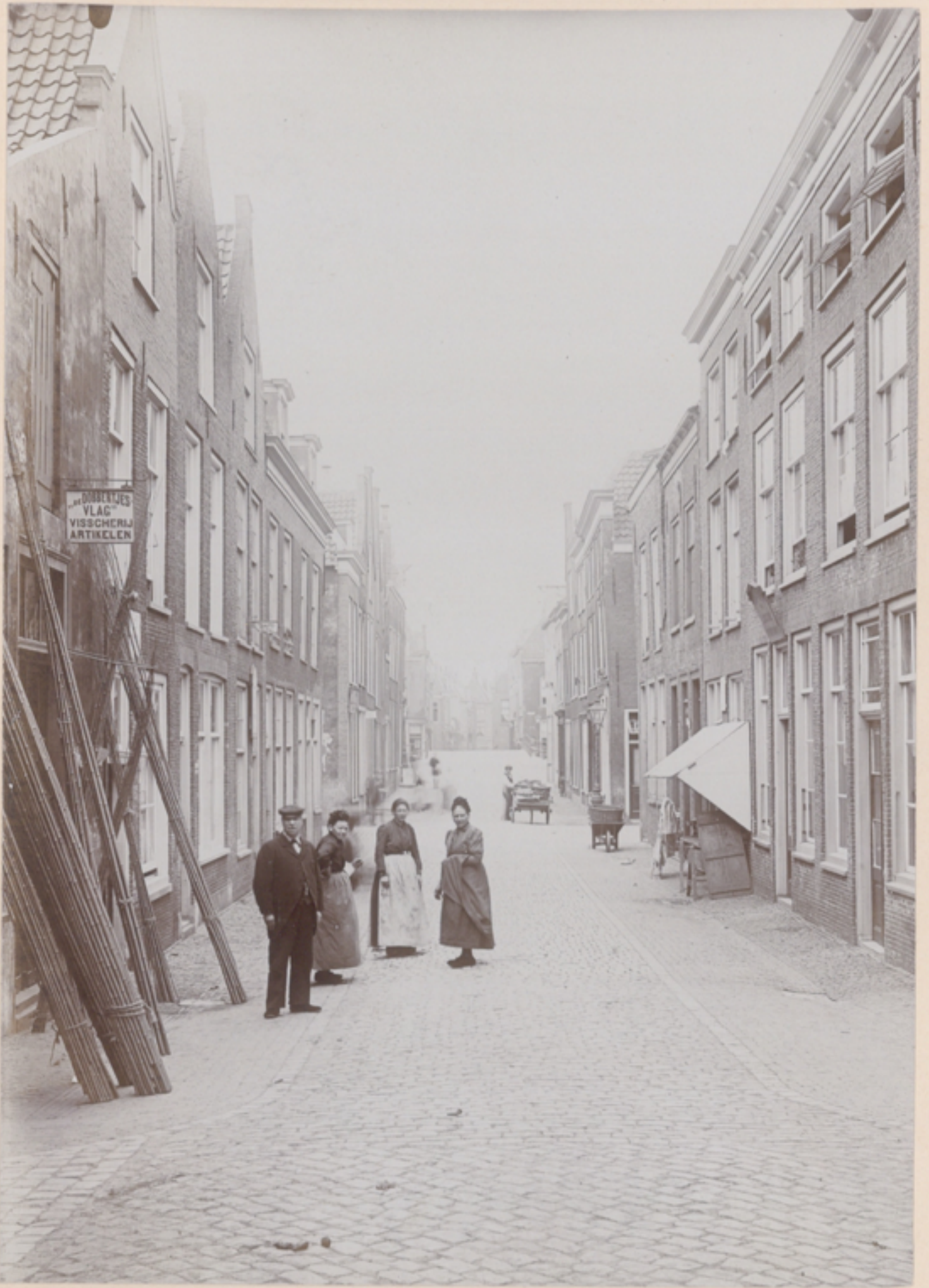
4e Groenesteeg, ca. 1880