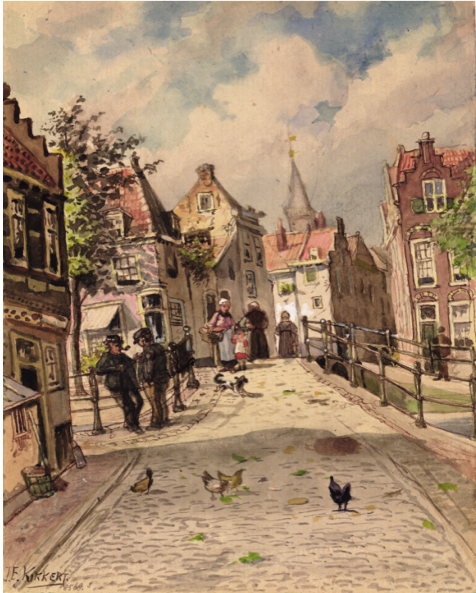
Groenesteg met brug over de Oranjegracht, Jan Elias Kikkert ca. 1875