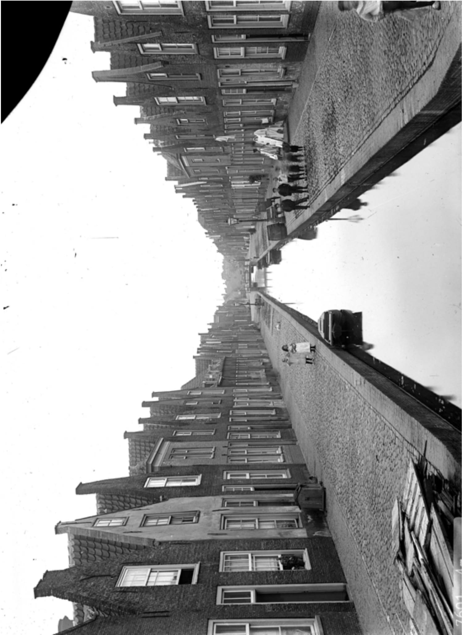
Wardgracht, ca. 1900