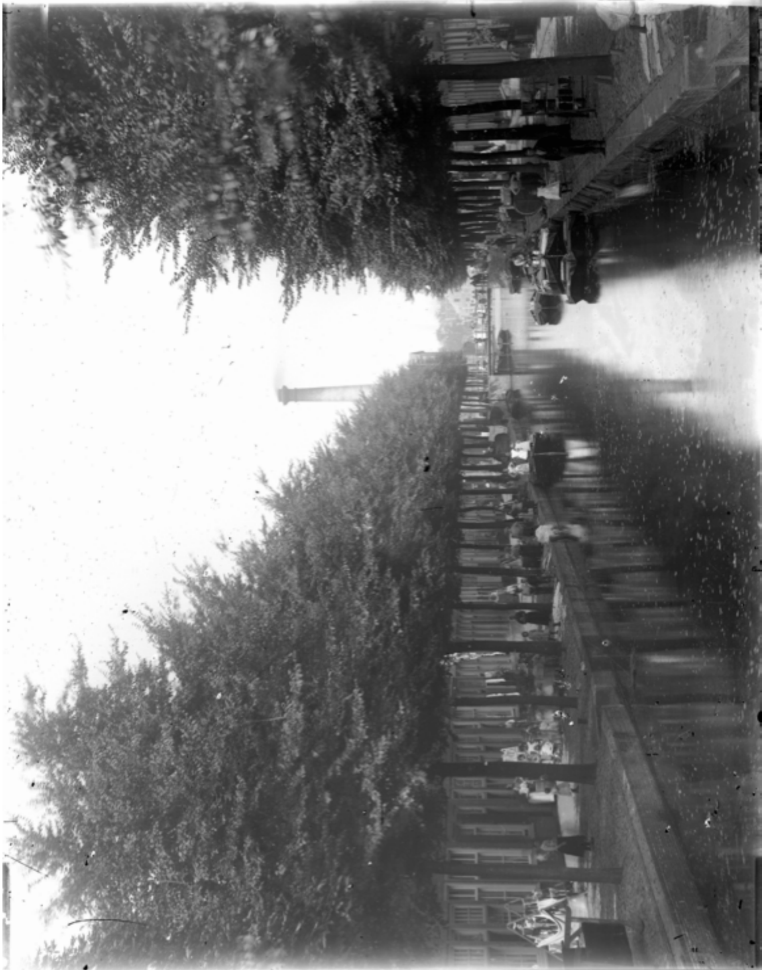
Oranjestad, ca. 1900